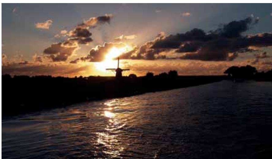
De Haarlemmermeerboezem nabij Weteringbrug.

Het voor de Haarlemmermeer ontwikkelde maatregelenpakket vermindert de overstromingsschade met meer dan 70 procent. Het pakket bestaat uit instroombeperkende maatregelen zoals boezemcompartimentering, maar ook maatregelen zoals het